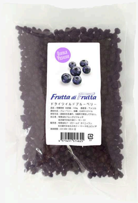
ワイルドブルーベリー